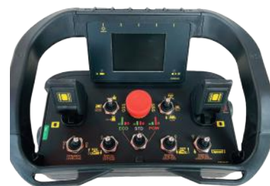
Radio console by AUTEC Console radio by AUTEC