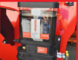
AGS (Automata zsírozórendszer)