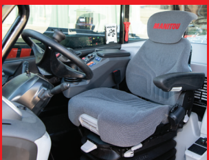
Adaptív légrugós ülés